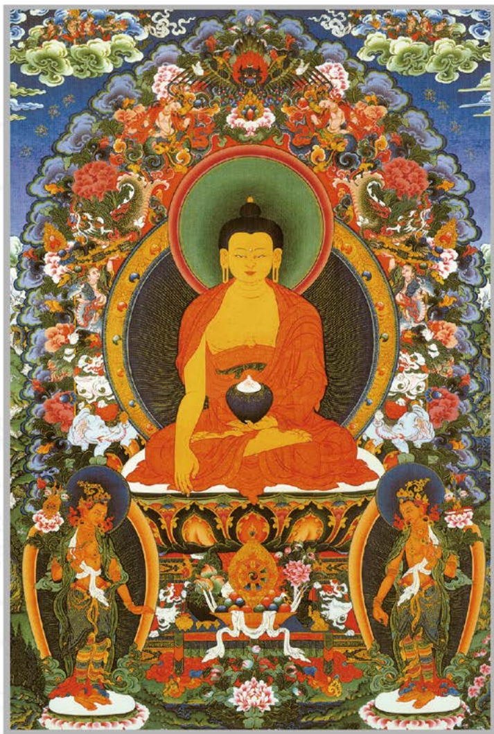
南无本师释迦牟尼佛