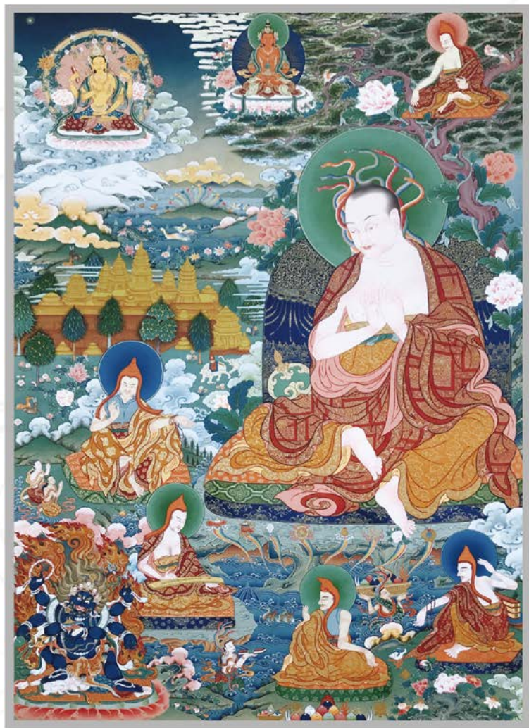
龙 树 菩 萨