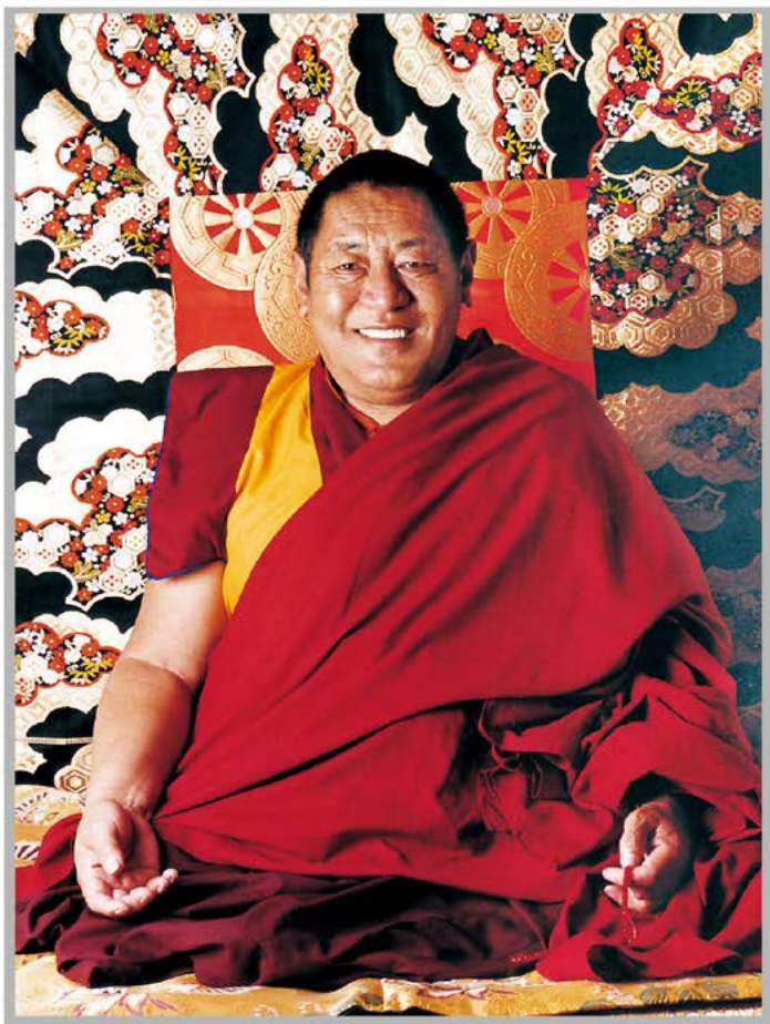
法王如意宝晋美彭措