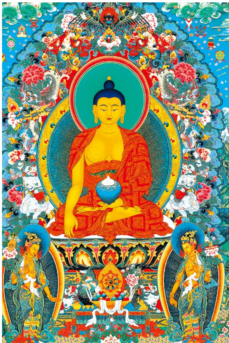
སངས་རྒྱས་ལྷན་ཐུབ་པ་ལ་ན་མོ། 南无释迦牟尼佛