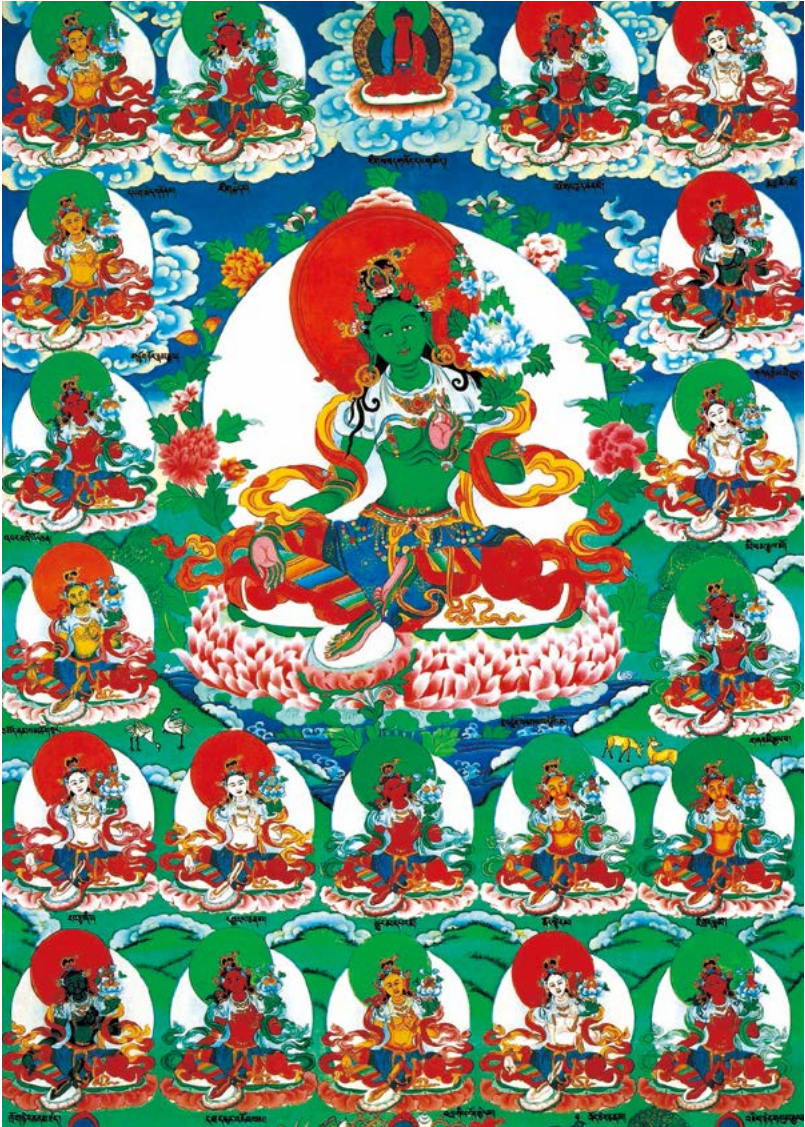
འསགས་མ་སྒྲོལ་མ་ཉེར་གཅིག་ལ་ན་མོ། 南无二十一度母